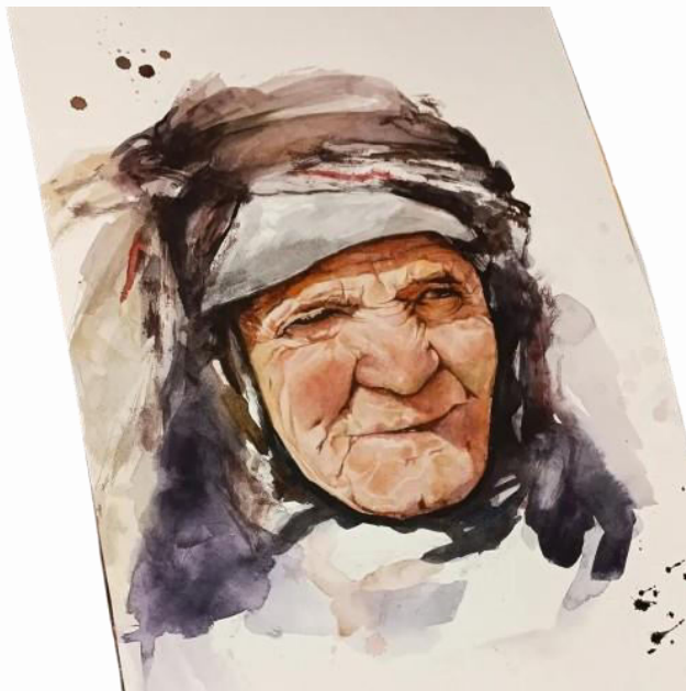
Картина от: Теодора Димитрова, 11.в клас